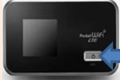
Pocket WiFi GL06P Y!mobile (旧イー・モバイル)

電源ボタンを約10秒間、長押ししてください。完全に立ち上がるまでに、30秒程かかります。