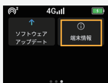
[ 端末情報 ] をタップ

一時的な不具合の場合、リセットで改善される場合がございます。再起動完了後は言語選択し、接続をお試しください。