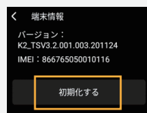
【初期化する】を選択